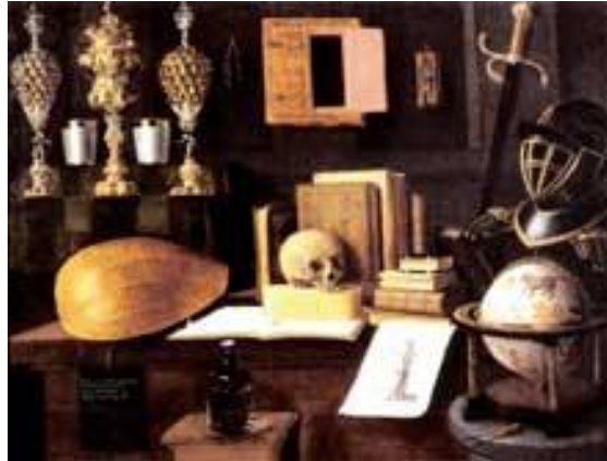
"La grande vanité" Sébastien Stoskopff (1641) Huile sur toile, 125 /165.

« Art, richesse, puissance et bravoure meurent Du monde et de ses œuvres rien ne demeure Après ce temps viendra l'Eternité Ô fous ! Fuyez la vanité ! »